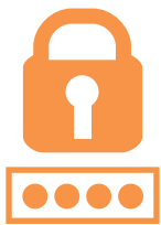
利用者証明用 パスワード (4桁)