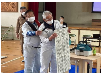
デモンストレーション 外壁について説明