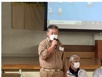
小学生の質問に真剣に答えています

授業では、前半に講話やデモンストレーション、インタビューを行い、「お家づくりと職人さんのお仕事」について学んでもらいました。皆、まっすぐな眼差しで真剣にお話を聞いていました。インタビューではたくさんの小学生が手を挙げ、様々な質問が上がりましたが、「失敗したことはありますか？」という素朴な質問に「もちろんあります！でも、失敗してもやり直して完成させればいいんです！」と真剣に答えていただき、建築業を通して大切なことも伝えられる授業だと思いました。