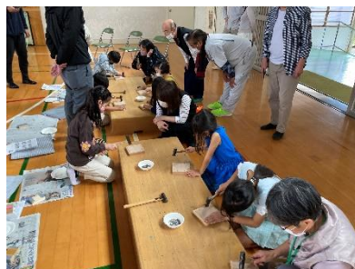
10名ずつのグループに分かれてレクチャー中

後半は、体験授業ということで、木と外壁材を使ったコースターづくりを行いました。実行委員の皆様には、参加者の安全面を第一に考えつつ、楽しい思い出になる体験を考えていただきました。当日の体育館は参加者の笑顔にあふれ、とても素晴らしい体験授業になりました！終了後の参加者アンケートでは、参加者全員から「またやりたい！」という言葉がもらうことができました。実行委員の皆様、素晴らしい授業をありがとうございました。