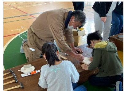
釘打ちに失敗した子をやさしくフォロー