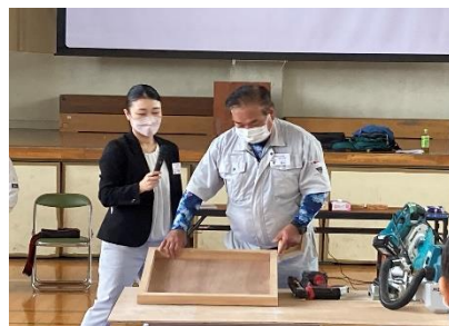
デモンストレーション 巨大木枠を作成

後半は、体験授業ということで、木と外壁材を使ったコースターづくりを行いました。実行委員の皆様には、参加者の安全面を第一に考えつつ、楽しい思い出になる体験を考えていただきました。当日の体育館は参加者の笑顔にあふれ、とても素晴らしい体験授業になりました！終了後の参加者アンケートでは、参加者全員から「またやりたい！」という言葉がもらうことができました。実行委員の皆様、素晴らしい授業をありがとうございました。