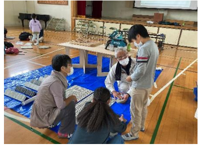
工作が終わり、個別に質問する様子