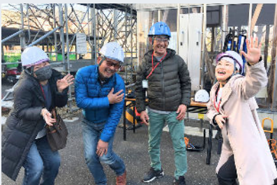
安全対策イメトレもばっちり (2023/12/7撮影)

謹んで新年のご挨拶を申し上げます。昨年は私もミドリ安全(株)様で落下比較などを体験し、「安全衛生推進」の重要性を再認識しました。2024年も業務改善や交流につながるイベント・情報配信の実現に向け尽力して参ります。