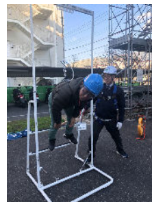
新井崎玉桶川支部長が体験。胴ベルトではみるみる首が真っ赤に。