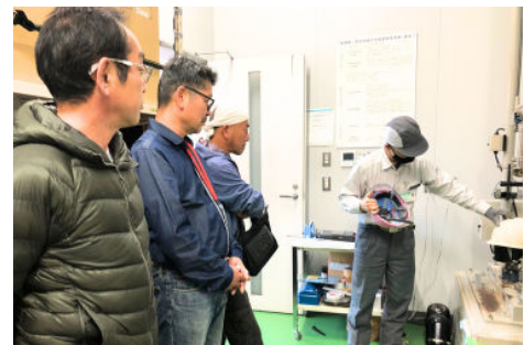
落下物の衝撃音にびっくり。保護帽の劣化チェック、定期的な交換の重要性を再認識。