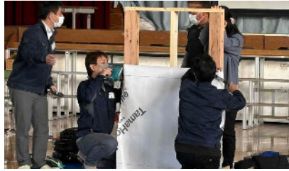
デモンストレーションでは壁工事を再現。断熱材を初めてみたという声も。