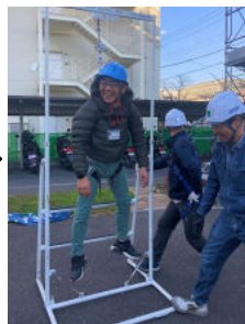
フルハーネスに体をしっかり支えられ、余裕の笑顔◎