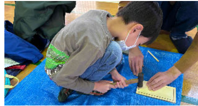
ガイドに沿って釘打ちに挑戦。