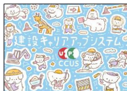
重本 結愛 様