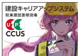
福嶋 里紗 様