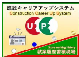
髙原 務仁 様