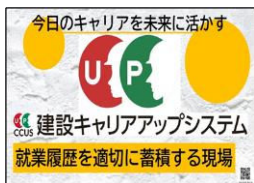
廣川 雅弘 様