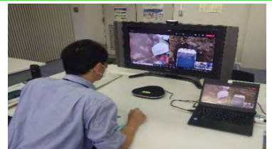
技術者が、カメラ映像を確認し、現場へ指示

・公共工事発注者への施工体制台帳の提出義務を合理化 （ICTの活用で施工体制を確認できれば提出を省略可）