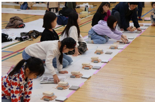
3種類の外壁材から好きなものを選びます