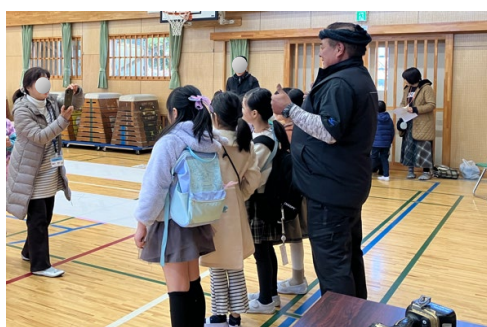
完成した作品をもって親方と記念撮影