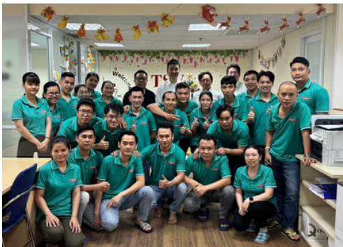
タマ・ソントン・ベトナム社みなさんと