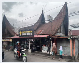
「ルマ・ガダン」という水牛の角を象った屋根が特徴的な家屋

他団体理事の「自社は25%が外国人材で、あと10年で50%を超えと思う。彼らのキャリアパスを考え、技能実習から努力を重ね、特定技能2号になった社員には子会社を任せると。お互いに尊厳をもってつきあい、国籍は関係なく目標を持っている人が結局は強いですね」というお話が大変印象的でした。また、不慣れな土地で受けた親切への個人的感謝は決して忘れない事、それは日本で過ごす外国人材も全く同じだと心から気づく事ができました。