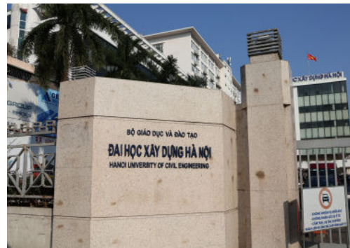
ハノイ建設大学正門