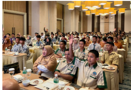
参加者からたくさんの質問が寄せられました