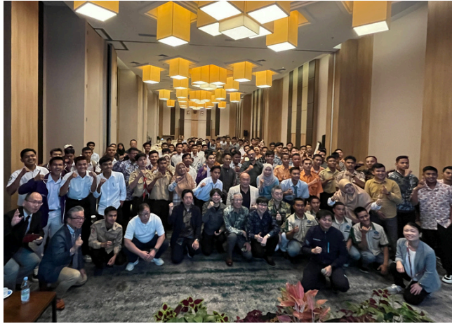
想定を上回る102名の参加者との記念撮影

日本とインドネシアの違いや、実際の先輩インドネシア人材の日本での生活の様子、各団体より職種の説明を行い、会場は満席でたくさんの質問が寄せられ大盛況でした。