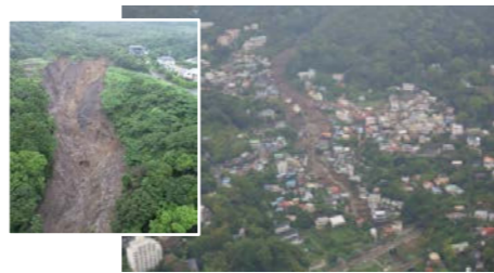
R3.7 静岡県熱海市 死者28名、住宅被害98棟