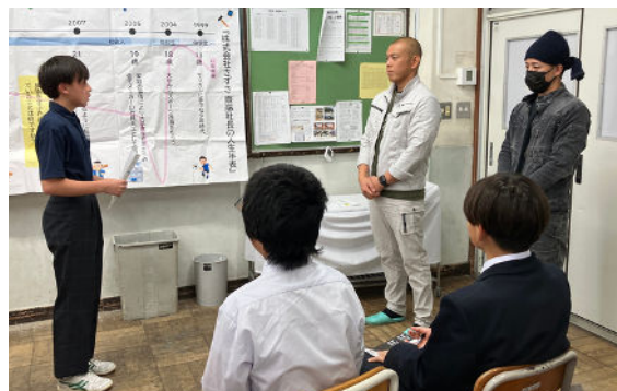
生徒代表による御礼の挨拶

教育委員会の依頼を受け、大工の仕事を紹介する講義と道具体験を行いました。最後には生徒代表が「視野が広がり参加してよかった」と感想を述べ、自分の言葉で感謝を伝えてくれた姿が印象的でした。