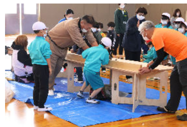
全員でカンナ削り体験