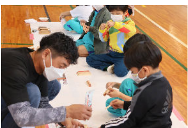
オリジナルプレートづくりに挑戦