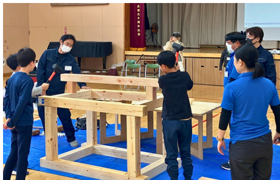
木組み体験でみんなで「ヨイショ」の掛け声