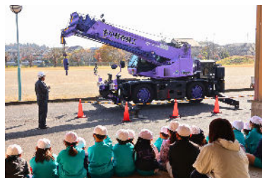
徐々に上がるクレーンに大歓声