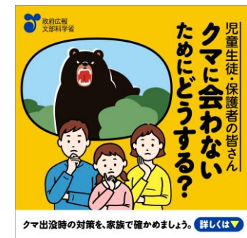
(児童生徒・保護者向け 静止画バナー広告)