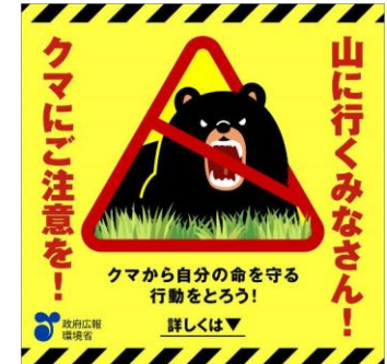
(静止画バナー広告)