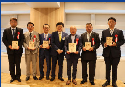
第4回在住協アワード受賞者のみなさま (6月25日撮影)