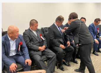
徽章をつけてスタンバイ中

毎年、受賞者の皆さまのお話を伺うたびに、多くの学びと元気をいただいています。8月号では受賞者特集を掲載予定です。ぜひご覧ください。